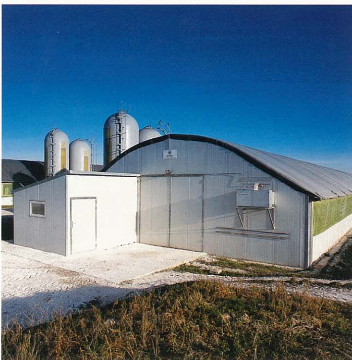
Tunnel 12 m avec local technique extérieur