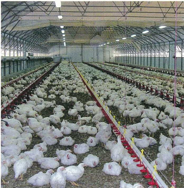
Tunnel 12 m avec ouvrants continus (poulets de chair)

RICHEL conçoit différentes options de ventilation et d'isolation pour vous offrir des bâtiments adaptés à votre élevage : poulets de chair (Industriels, Labels), poules pondeuses (au sol, en batterie), dindes, cailles, reproducteurs, etc.