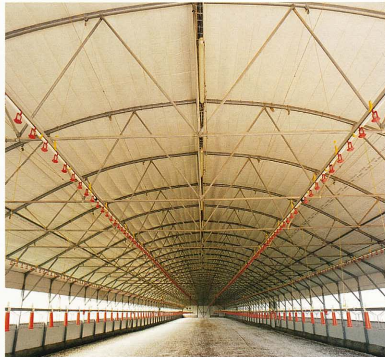
Tunnel 12 m